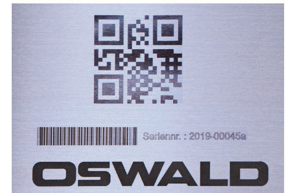
Beispielmarkierung auf VA