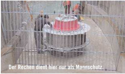
Der Rechen dient hier nur als Mannschutz.