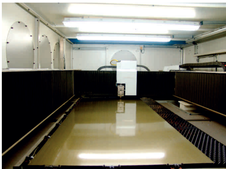
Hochdynamisches Schneiden von Dynamoblechen mit Beschleunigungen bis 4g. Die maximale Beschleunigung beträgt 7g.