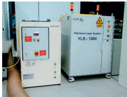
Die 1-kW-Faserlaserstrahlquelle (rechts) und das Laserkühlgerät.

der Schneidkopf mit einem Schutzglas ausgestattet. Eine Kassette, in der sich das Schutzglas befindet, ermöglicht eine einfache Kontrolle und das schnelle Wechseln. Die Schutzglaskassette wird zusätzlich auf Anwesenheit kontrolliert. Oswald Elektromotoren hat die Laserschneidanlage bereits seit einigen Monaten im Einsatz. Hinsichtlich der Laserstrahlquelle erfolgte die Festlegung durch die Oswald Elektromotoren.